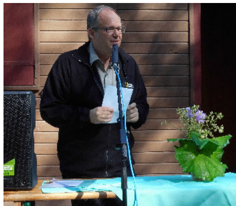
Pastor bei der Predigt