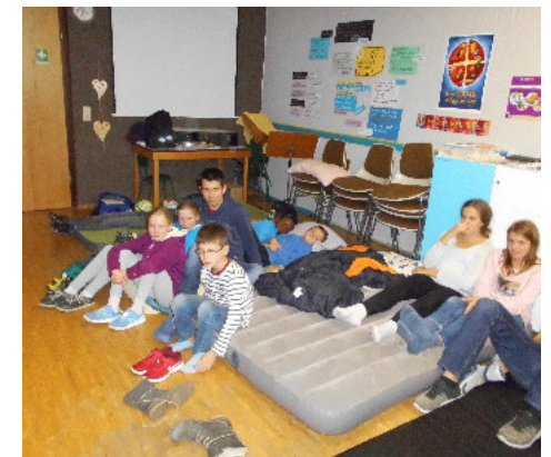
Bei der Gute-Nacht Geschichte