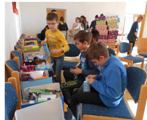
Beim Päckchen packen