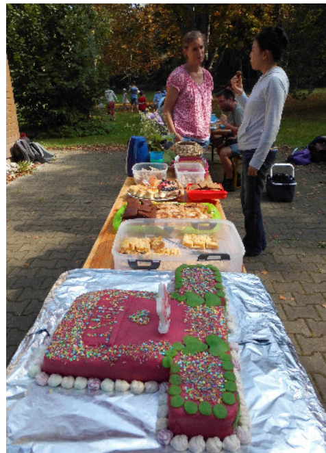
Geburtstagskuchen und Kuchenbuffet