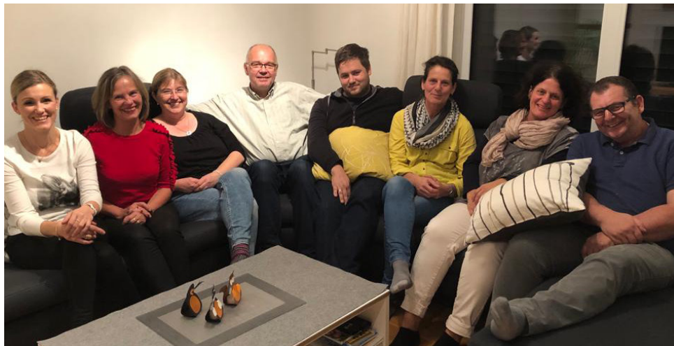
Spurgruppe bei der 4. Sitzung

• Uns ist klar, dass allein eine tolles Gebäude oder tolle Veranstaltungen nicht dazu beitragen können, damit Menschen eine