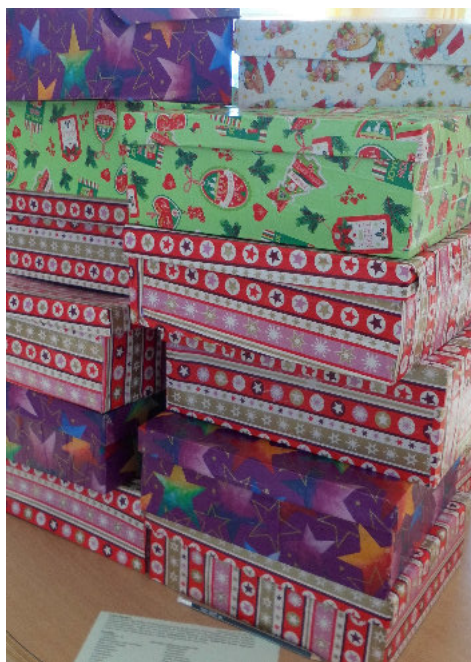
Päckchen warten darauf gepackt zu werden